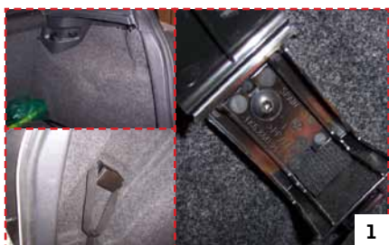
Bild 1 Seitenverkleidung im Kofferraum demontieren, dazu vorsichtig den Teppich aus der Verkleidung ziehen (links muss zusätzlich der Warn-dreieckhalter abgeschraubt werden).

Dies ist eine Installationshilfe. Wenn Sie es sich nicht zutrauen unsere Produkte selbst einzubauen, dann suchen Sie bitte eine Fachwerkstatt auf, um mögliche Schäden am Produkt und Ihrem Fahrzeug zu vermeiden. This is an installation aid. If you dare to be not even install our products, then look for a Fachwerkstatt to avoid possible damage to the product and your vehicle.