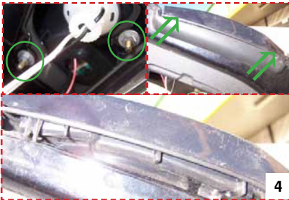
Bild 4 Zwei Befestigungspunkte, Muttern M8 lösen, Stecker durch leichten Druck auf die beiden Verriegelungsspannen entfernen.

LED Taillights VW Golf VI LIGHTBAR CarDNA